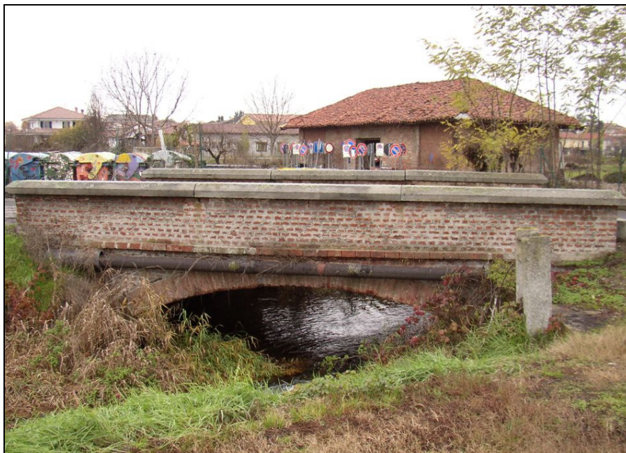
PONTE BARIPO003 (da: BUGNAG016 – foto 016)