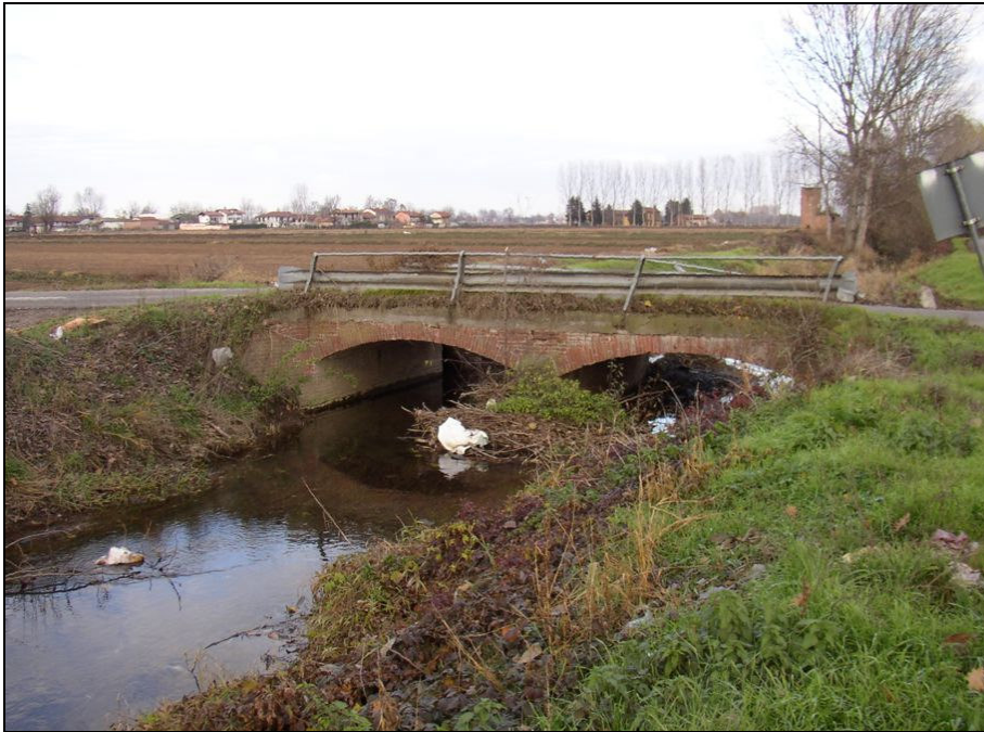
PONTE BARIPO005 (da: BUGNPO002 – foto 024)