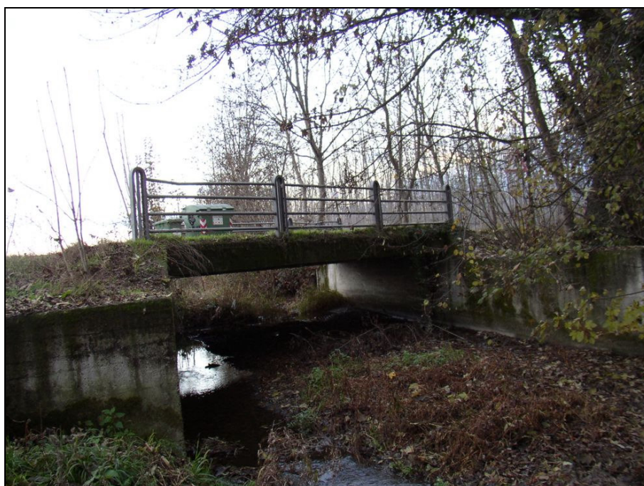
PONTE BARIPO002 (da: BUGNAG002 – foto 031)