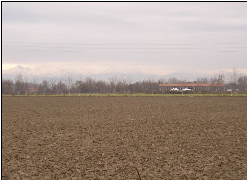
ARGINE BARIAR016 (da: BUGNAR001 – foto 008)