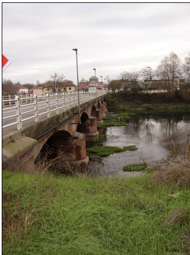
PONTE BARIPO001 (da: BUGNPO001 – foto 020)