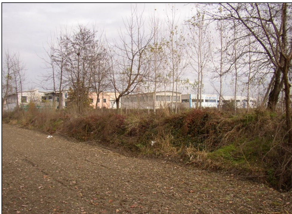
ARGINE BARIAR017 (da: BUGNAR010 – foto 006)