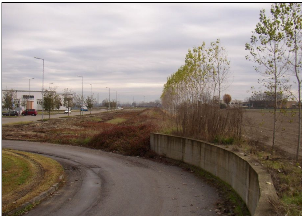
ARGINE BARIAR017 (da: BUGNAR010 – foto 002)