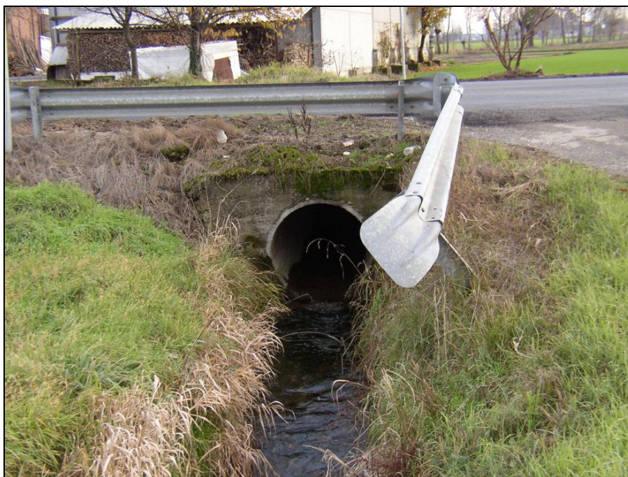
ATTRAVERSAMENTO BARIAG007 (da: BUGNA004 – foto 029)