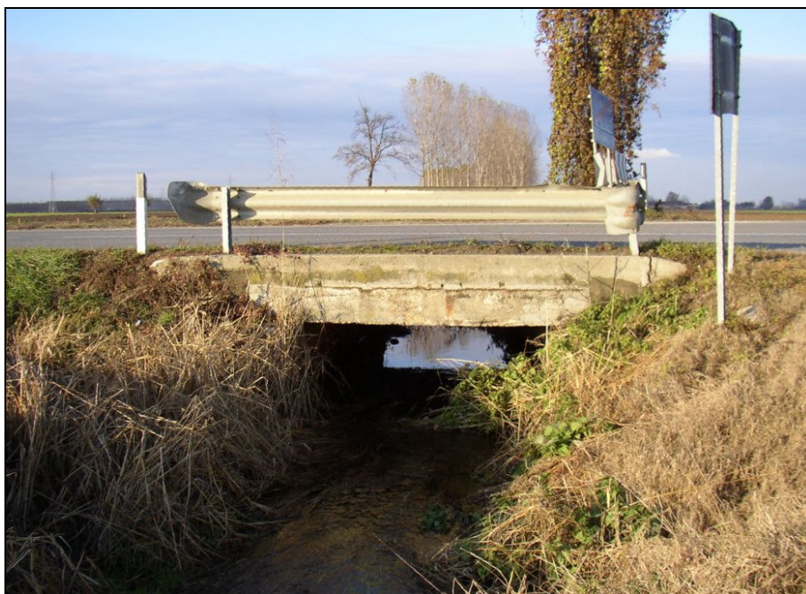
ATTRAVERSAMENTO BARIAG010 (da: BUGNAG011 – foto 026)