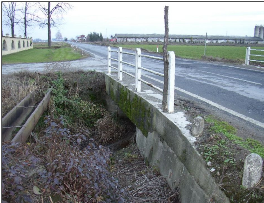
ATTRAVERSAMENTO BARIAG001 (da: BUGNAG001 – foto 032)