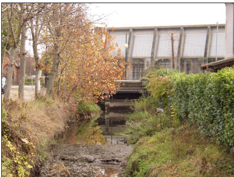
ATTRAVERSAMENTO BARIAG002 (da: BUGNAG014 – foto 011)