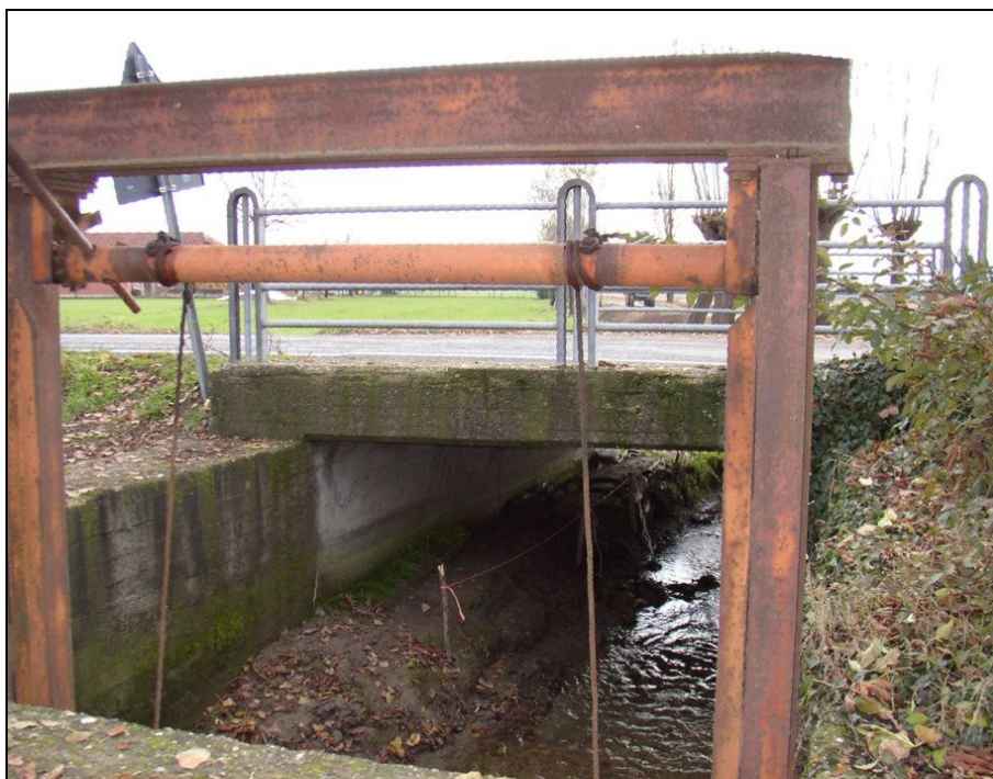
ATTRAVERSAMENTO BARIAG006 (da: BUGNAG003 – foto 030)