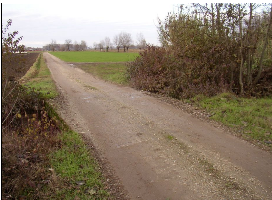
ATTRAVERSAMENTO BARIAG004 (da: BUGNAG018 – foto 023)