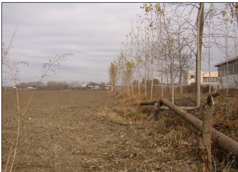
ARGINE BARIAR017 (da: BUGNAR010 – foto 007)