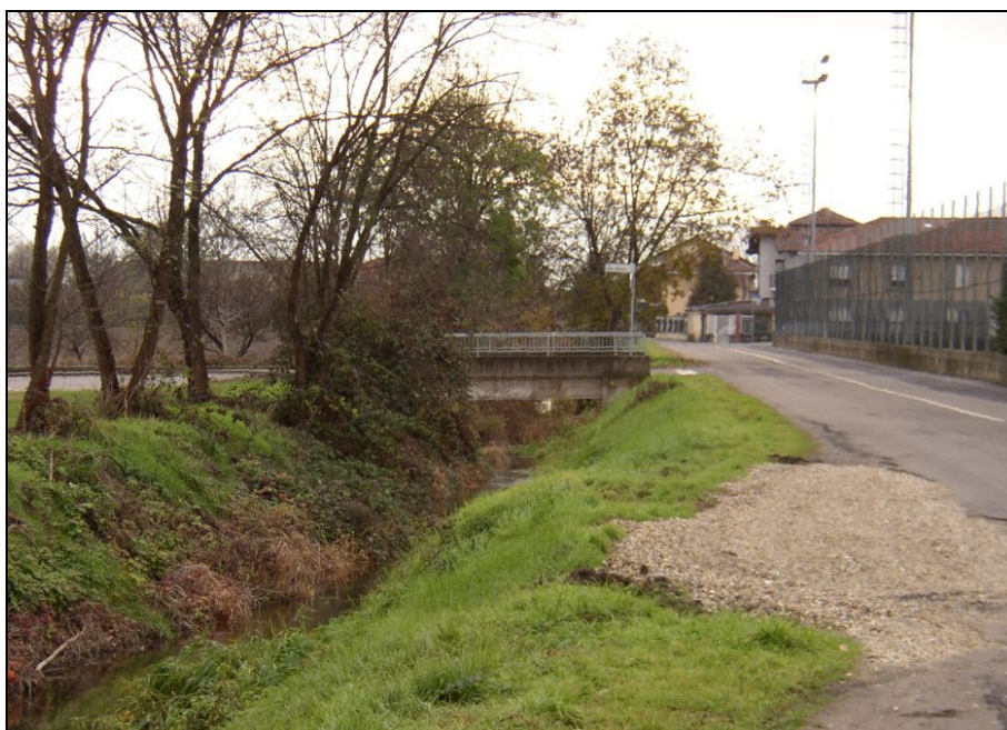
PONTE BARIPO004 (da: BUGNAG017 – foto 017)