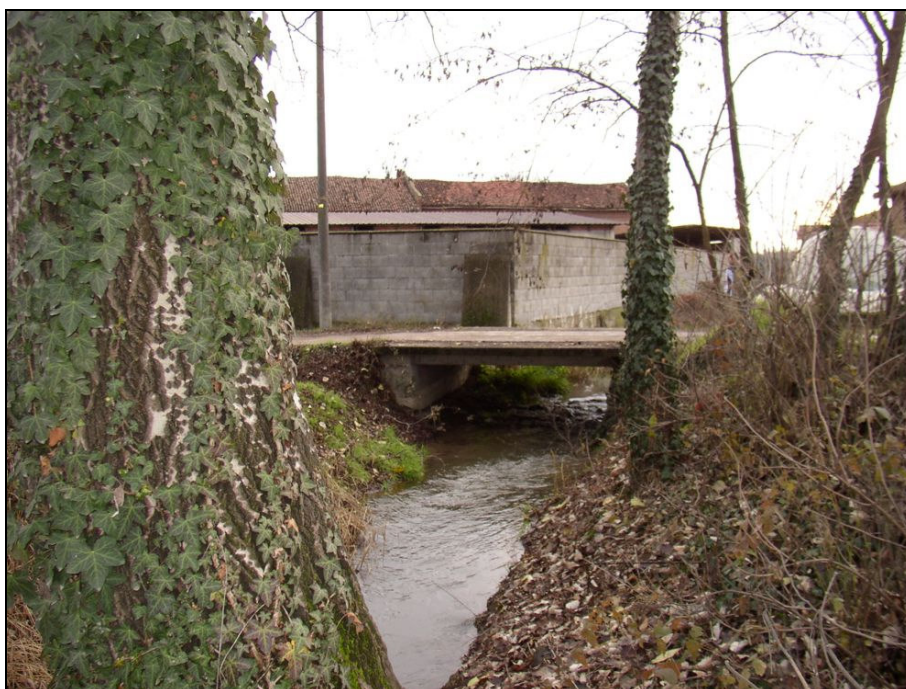
ATTRAVERSAMENTO BARIAG009 (da: BUGNA007 – foto 021)