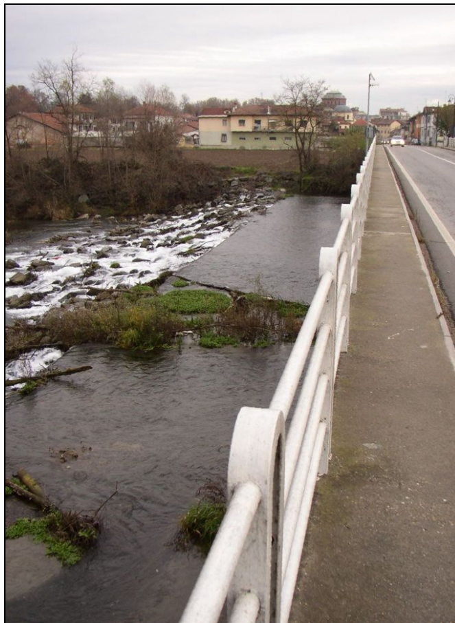
SOGLIA BARISO002 (da: BUGNSO001 – foto 019)