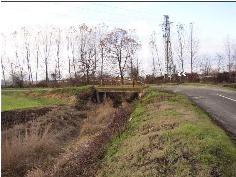
PONTE BARIPO006 (da: BUGNPO003 – foto 025)