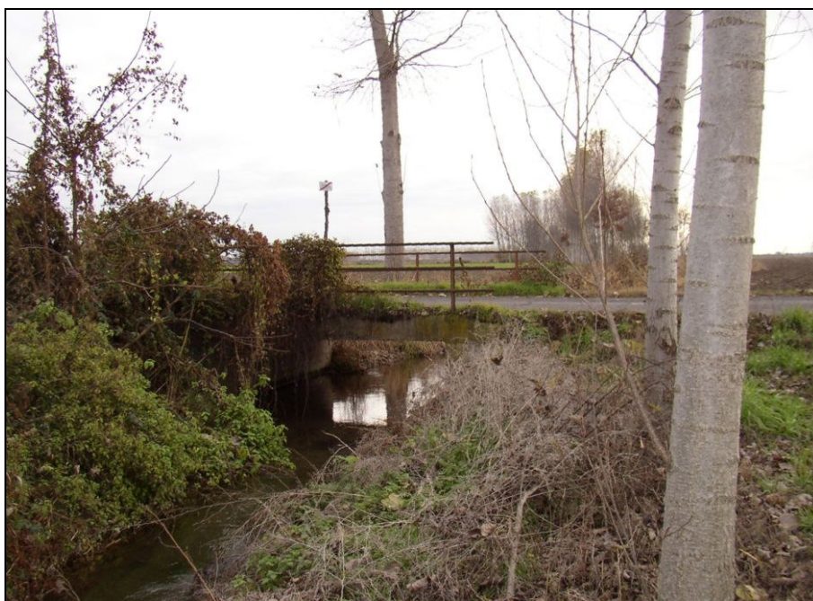
ATTRAVERSAMENTO BARIAG003 (da: BUGNA006 – foto 022)