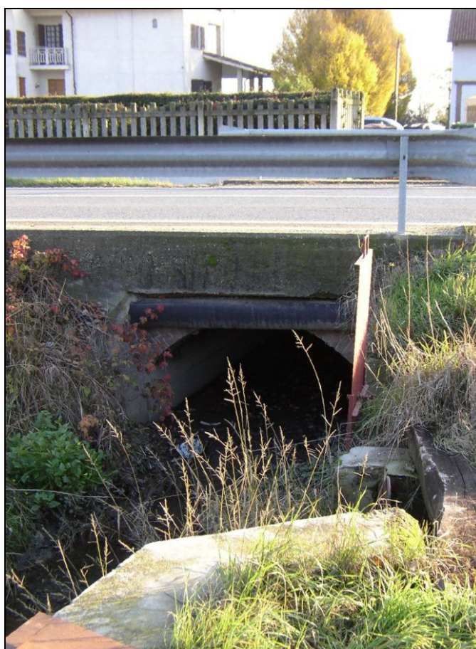
ATTRAVERSAMENTO BARIAG008 (da: BUGNAG009 – foto 027)