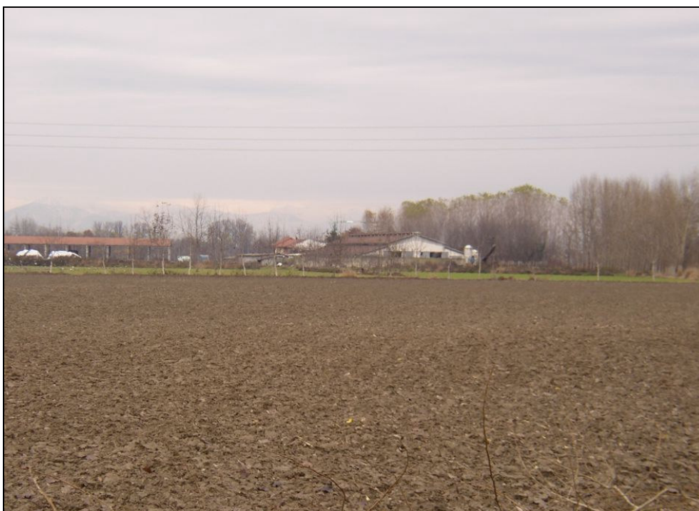
ARGINE BARIAR016 (da: BUGNAR001 – foto 009)