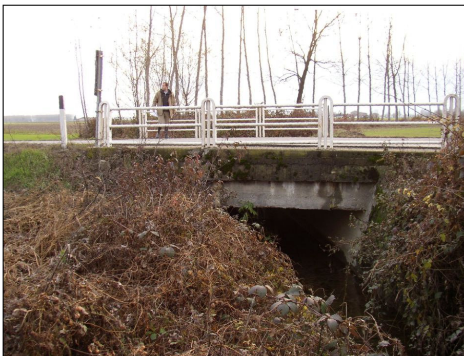
ATTRAVERSAMENTO BARIAG005 (da: BUGNA005 – foto 028)